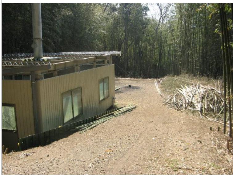
屋根をはずした中には、ペットを燃やす炉が。